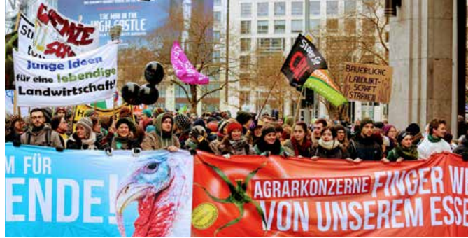
Wir haben es satt!-Demo 2017